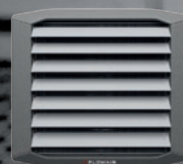
Nagrzewnica LEO FB V