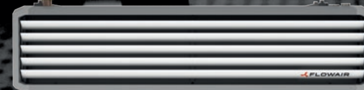
Kurtyna ELiS T